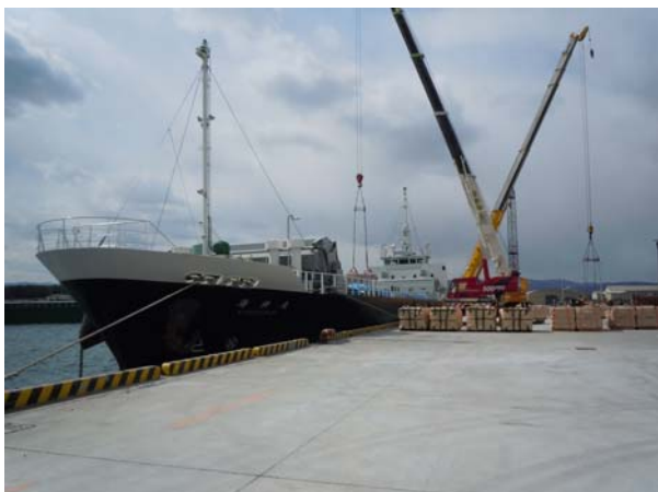
震災当日の地震発生前