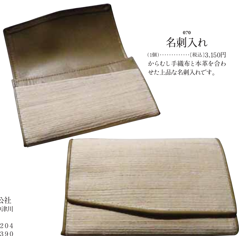
070 名刺入れ (1個)……………[税込]13,150円 からむし手織布と本草を合わせた上品な名刺入れです。

株式会社 奥会津昭和村振興公社 福島県大沼郡昭和村下中津川 字中島611 電話 / 0241-57-2204 FAX / 0241-57-2390 URL / http://www.showa-karamushi.com/