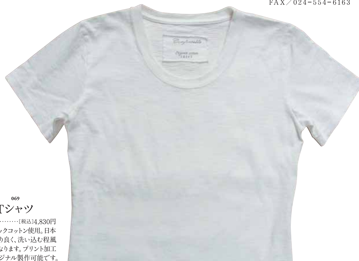
069 Tシャツ (1枚)……………[税込]4,830円 オーガニックコットン使用。日本製。肌触り良く、洗い込む程風合が良くなります。プリント加工等でオリジナル製作可能です。

わ田や合同会社 福島県福島市丸子字町裏 17-1-103 電話 / 050-3464-9744 FAX / 024-554-6163