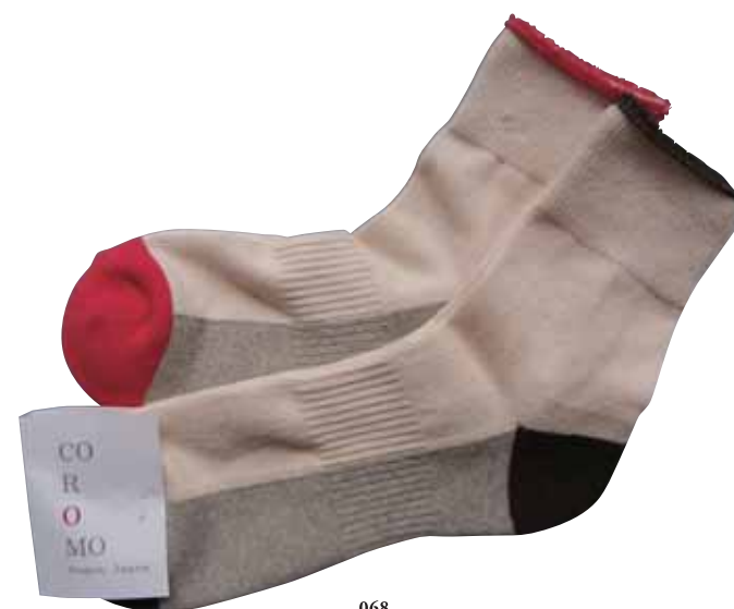
068 足底パイル コンビ靴下 (1足)……………[税込]1,680円 福島県産の有機栽培原綿使用。放湿性やクッション性など、足のコンディションを保つ機能に優れています。