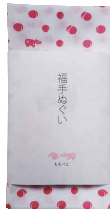
067 福手ぬぐい (1枚)……………[税込]1900円 福島県産の有機栽培原綿使用。伝統的な手ぬぐいに県自慢の産品をモチーフにしたデザインを表現しています。プリント加工などでオリジナル製作可能です。