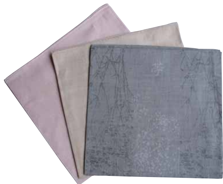
071 ハンカチーフ (1枚)……………[税込]15,250円 からむしと絹の交織でスカーフにも使える大判のハンカチ。色は全3色。男性にも女性にもお使いいただけます。